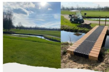
Hole 6 Griendbaan Andere afslagplaats voor 48 (rood)

Afgelopen jaar is tijdens het zomerseizoen de rode tee op hole 6 van de Griendbaan verplaatst. De tee is dichterbij de hole geplaatst en ligt nu wat hoger. De brede waterhindernis, waar voorheen overheen afgeslagen moest worden, is in de huidige lay out nog een smalle sloot. De afstand naar de hole is teruggebracht van 153 naar 91 meter. Hiermee werd een kortere en eenvoudiger par 3 voor 'rood' (en 'oranje') gecreëerd. Na het eerste seizoen leek het ons leuk om het effect van de verplaatsing te analyseren.